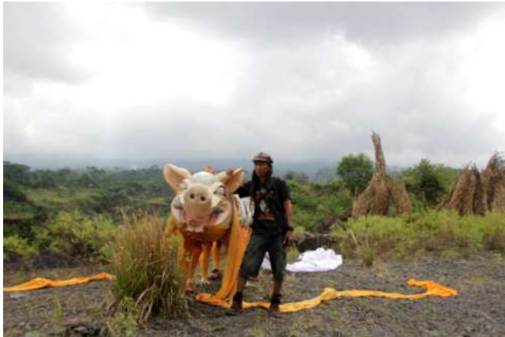
Display karya di areal bekas penambangan pasir Desa Peringasari, Selat, Karangasem