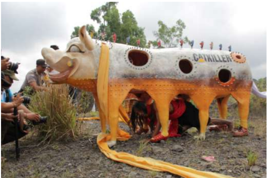
Pembukaan pameran dengan ferformance art Pagelaran Seni Pupa “Celeng Ngelumbar”