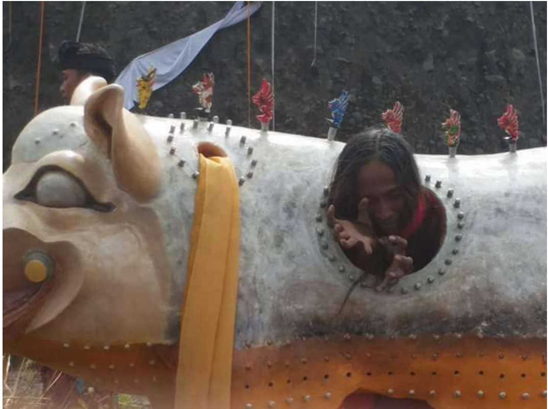
Pembukaan pameran dengan ferformance art Pagelaran Seni Pupa “Celeng Ngelumbar”