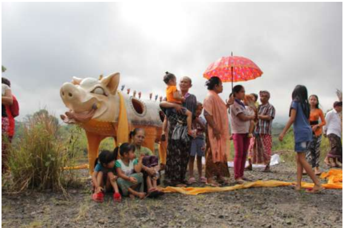
Pembukaan pameran dengan ferformance art Pagelaran Seni Pupa “Celeng Ngelumbar”