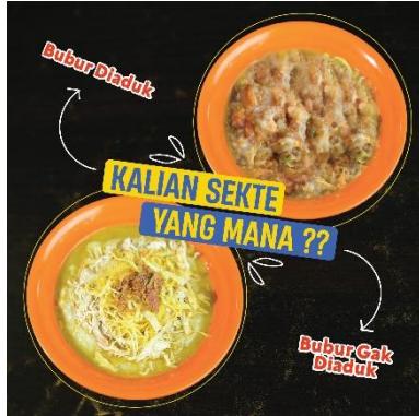
Gambar 10. Feed 2