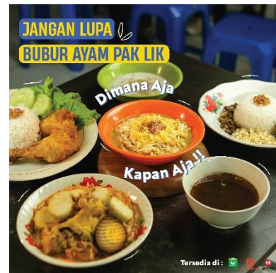
Gambar 15. Feed 7

Diatas adalah Hasil dari desain feed Instagram yang sudah melewati tahap approval . Beberapa desain konten berisi tentang produk makanan dari Bubur Ayam Pak Lik untuk memberikan informasi tentang produk yang di jual