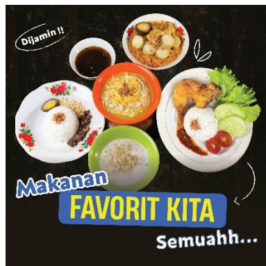
Gambar 12. Feed 4