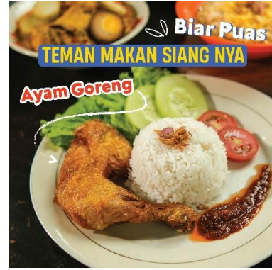
Gambar 13. Feed 5