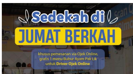
Gambar 8. Teks

Dan untuk subheadline merupakan kalimat penjelas dari headline , berisi pesan singkat namun dapat memberikan kejelasan headline . Serta Peletakan teks pada feed Instagram di sesuaikan dengan komposisi dari konten foto yang ada.