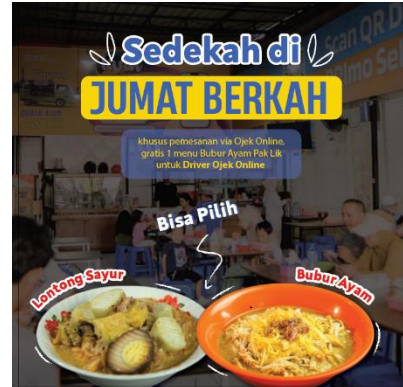
Gambar 9. Finishing

Pada tahap ini desain yang sudah di buat masuk ke dalam proses finishing yaitu memberikan sentuhan terakhir berupa elemen – elemen pemanis dalam desain feed Instagram berupa outline untuk menambah nilai estetika pada desain.