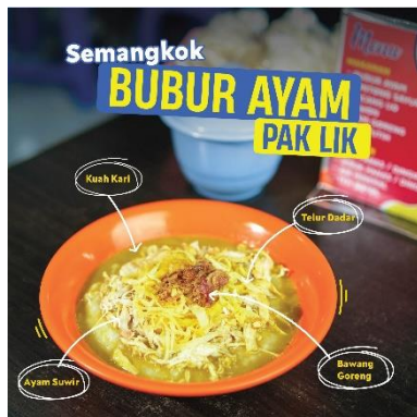
Gambar 11. Feed 3