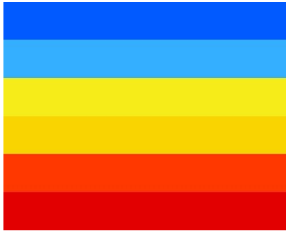
Gambar 7. Palet warna

dominan karena memberikan kesan modern pada desain namun tetap tidak menghilangkan kesan kelegendarisan dari gaya fotografi dan warna fotografi dari feed Instagram Bubur Ayam Pak Lik.