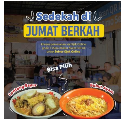
Gambar 14 Feed 6