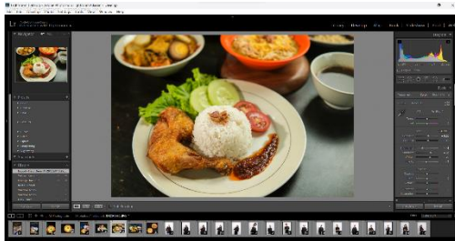
Gambar 3. Editing Foto