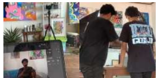
Gambar 3. Proses pengambilan gambar