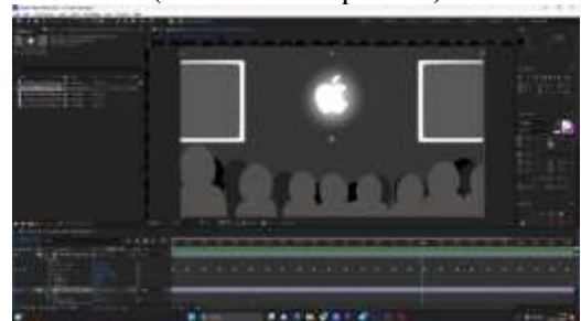
Gambar 4. Proses pengerjaan motion