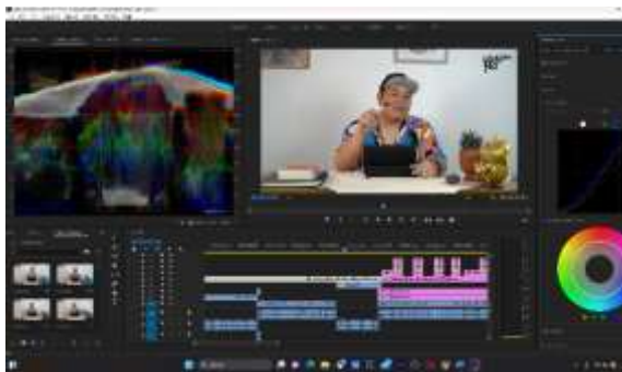
Gambar 1. Proses color Grading

pengembangan mahasiswa. Kebaruan teknologi yang didapat saat melaksanakan magang di HNS Studio terutama saat mengerjakan proyek animasi yang diberikan ialah color grading . Color Grading merupakan sebuah proses mengubah warna baik pada media foto ataupun video. Proses koreksi warna ini dapat dilakukan dengan berbagai cara, mulai dari shoot matching , shape mask , removing objects , dan lain lain. Dengan color grading dapat memberikan kesan warna semakin sesuai dengan mood yang dibawakan dalam sebuah video.