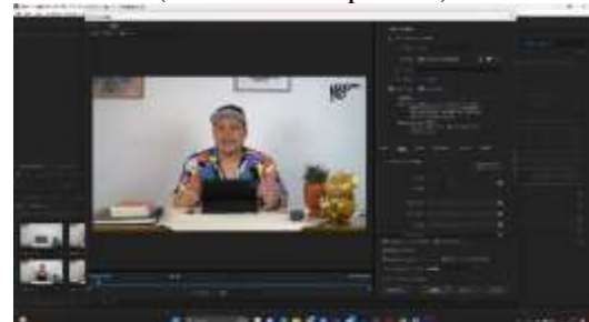
Gambar 5. Proses rendering

Berdasarkan proses pengerjaan konten yang dimulai dengan pembuatan ide dan konsep, proses pengambilan gambar hingga editing . konten video HNS Studio menggunakan format mp4 dengan