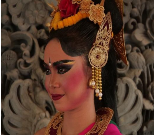
Tata rias penari tampak samping (mata terbuka)