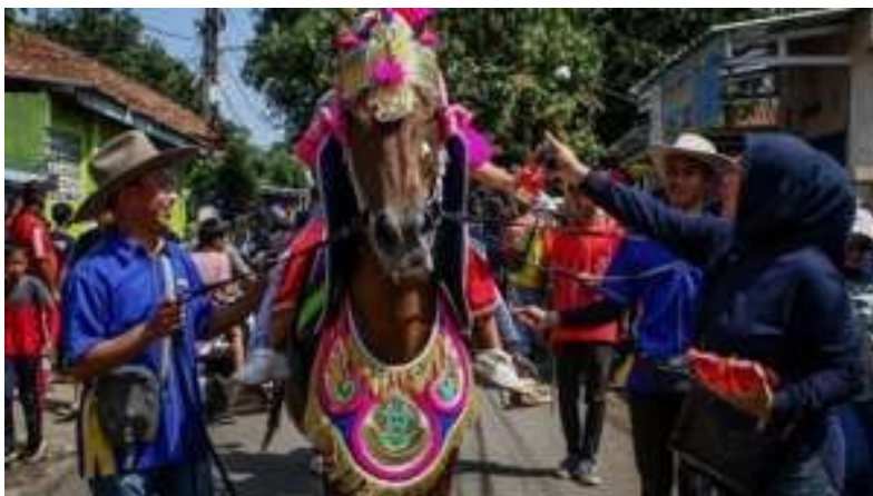
Gambar 1. 3 Festival Kuda Renggong

terhadap kuda-kuda miliknya, terutama gerakan kepala dan kaki, ia mengembangkan sebuah seni pertunjukan yang unik, yaitu kuda yang "menari" mengikuti irama musik tradisional seperti kendang dan gong (Deden, 2012). Perkembangan Kuda Renggong kemudian melibatkan banyak warga desa yang tertarik untuk mempelajari dan melestarikan tradisi ini, sehingga kesenian ini menjadi warisan kolektif masyarakat setempat. Selain sebagai hiburan, Kuda Renggong juga berfungsi sebagai simbol identitas budaya dan kebanggaan komunitas Sunda di Kabupaten Sumedang.