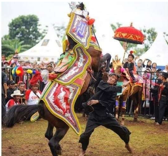
Gambar 1. 1 Salah Satu Atraksi Pertunjukan Kuda Renggong

pariwisata dan sering dipentaskan dalam festival budaya serta upacara adat (Deden, 2012; Kitaplus, 2025).