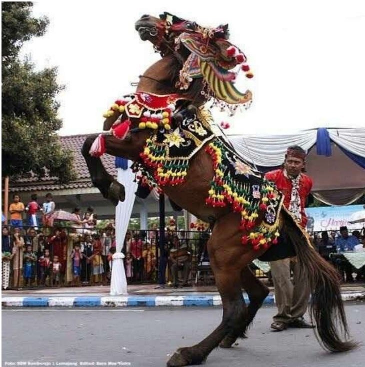
Gambar 1. 2 Atraksi Jaran Kencak

indah dan rumit, warna-warna cerah mencolok, serta hiasan manik-manik dan kain sutra yang mempercantik penampilan kuda dan penunggangnya. Pertunjukan ini menampilkan harmoni antara gerak kuda yang terlatih, musik tradisional pengiring, dan ekspresi penunggang yang anggun, sehingga menjadi tontonan yang memukau sekaligus sarat makna budaya (Kitaplus, 2025).