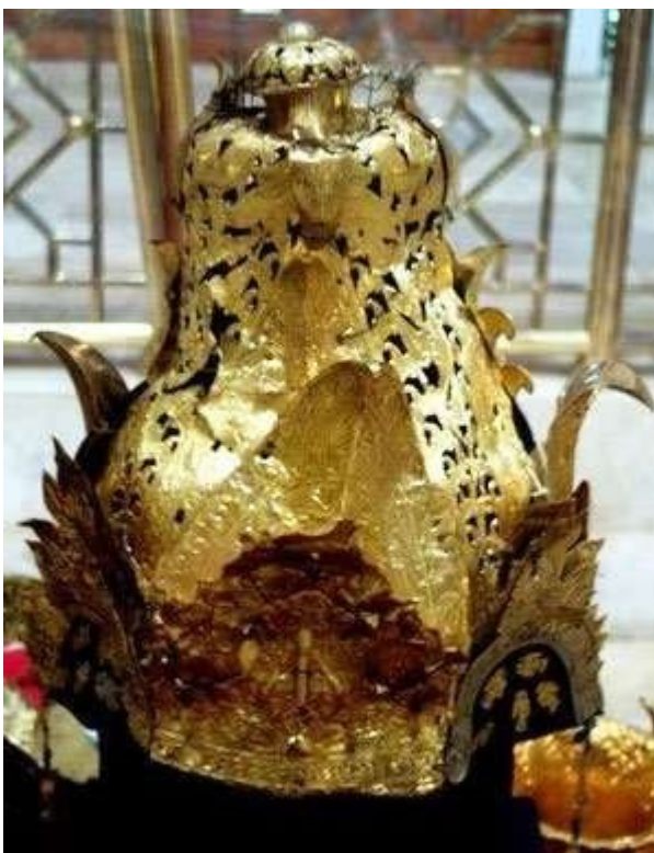
Gambar 3. 1 Mahkota Binokasih

tetapi juga sebagai simbol dukungan politik Madura terhadap ambisi Geusan Ulun untuk menguatkan posisi Sumedang Larang sebagai penerus kejayaan Pajajaran dan penantang dominasi Cirebon. Keberadaan mereka memperkuat kekuatan militer dan legitimasi politik Sumedang dalam menghadapi konflik yang kemudian memicu perang selama tiga tahun antara Sumedang dan Cirebon (Tubagus et al., 2021). Sebagai buktinya diserahkan mahkota Binokasih ke Sumedang Larang (lihat gambar 3.1).