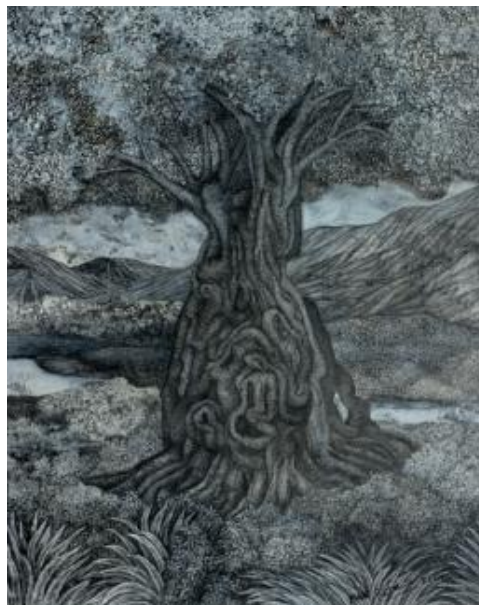
Aku Ada Untukmu, 2024, tinta di atas kanvas, 70 x 60 cm

Art Jakarta 2024. Karya Lukisan Alam, Aku Ada Untukmu menempatkan alam sebagai sosok yang hadir setia bagi kehidupan manusia. Alam digambarkan bukan sebagai objek yang dieksploitasi, tetapi sebagai sahabat yang memberi ruang, perlindungan, dan kehidupan tanpa pamrih. Melalui karya ini, penulis menyampaikan pesan bahwa alam selalu hadir dan memberi, bahkan ketika manusia sering lalai dan melupakan tanggung jawabnya. Lukisan ini menjadi ajakan untuk kembali menyadari hubungan yang saling membutuhkan, di mana manusia dituntut untuk merawat dan menghargai alam sebagaimana alam telah menjaga kehidupan manusia.