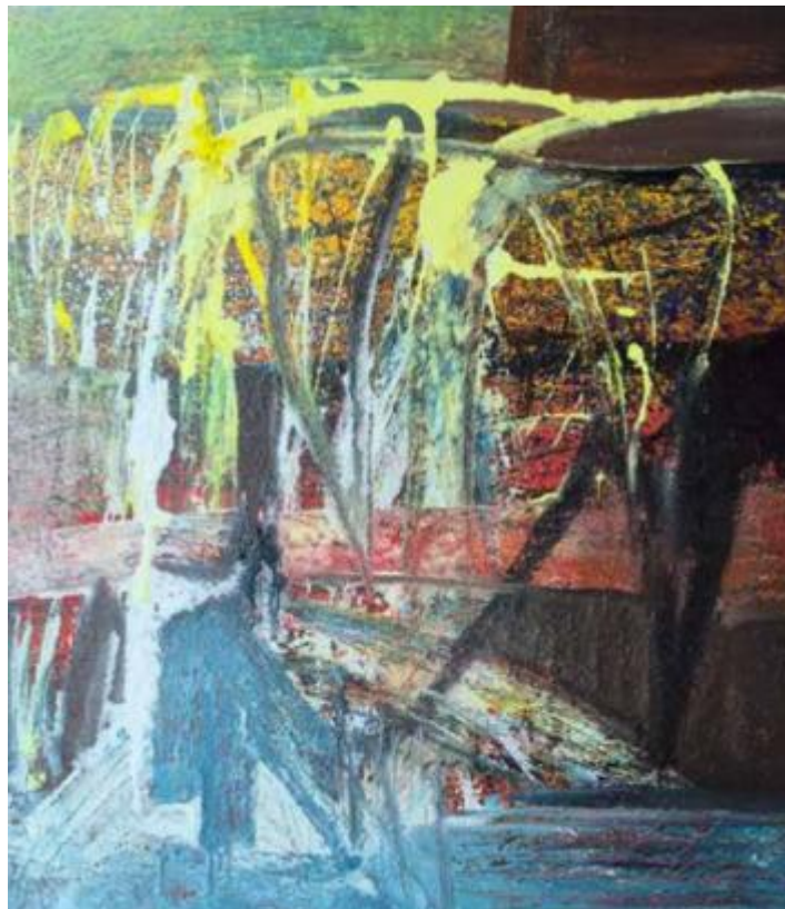
Bisikan Semesta, 2024. Akrilik di atas kanvas, 80 x 70 cm

Karya Bisikan Semesta menghadirkan alam dan kehidupan sebagai ruang sunyi yang penuh tanda dan pesan. Bisikan tidak datang dengan suara keras, tetapi hadir melalui gerak, cahaya, perubahan, dan keheningan yang sering luput dari perhatian manusia. Karya ini mengajak penulis dan penikmatnya untuk lebih peka, mendengar dengan rasa, dan membuka kesadaran bahwa semesta selalu berkomunikasi. Melalui Bisikan Semesta , alam dipahami sebagai guru yang halus, memberi petunjuk tentang keseimbangan, keterhubungan, dan arah hidup manusia.