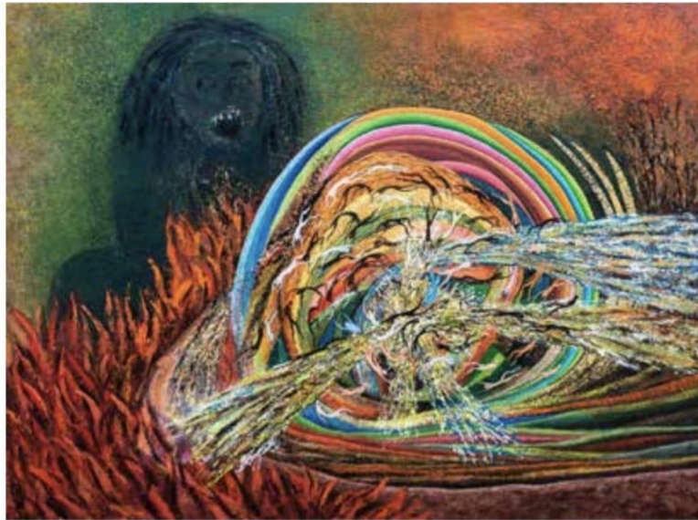
Pakeling, 2023, Akrilik di atas kanvas 196 x 146 cm

Karya Abstraksi Tri Tunggal mengangkat makna kesatuan dari tiga unsur utama yang membentuk keseimbangan hidup. Tiga elemen ini tidak dipahami sebagai bagian yang terpisah, tetapi sebagai satu kesatuan yang saling menguatkan dan saling mengisi. Melalui bentuk-bentuk abstrak, karya ini menekankan hubungan antara manusia, alam, dan dimensi spiritual sebagai satu napas kehidupan. Tri Tunggal hadir sebagai refleksi bahwa keharmonisan tercipta ketika ketiganya berjalan seimbang dalam satu kesadaran utuh.