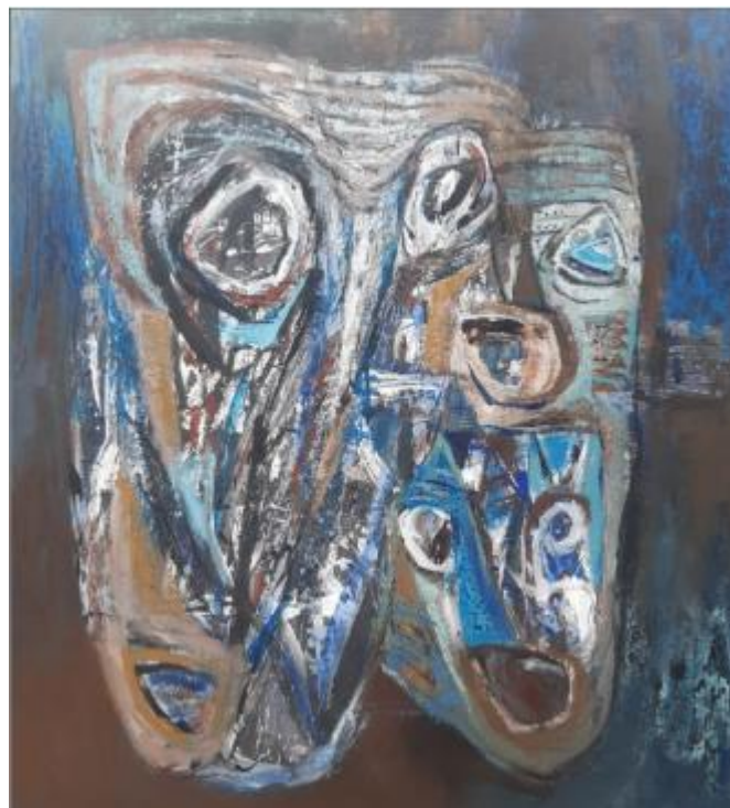
Masa Lampau, 2023, akrilik di atas kanvas, 135 x 125 cm

Pameran Seni Visual Gedung D, Kementerian Pendidikan, Budaya, Riset dan Teknologi, 10 Nopember 2023 – 10 Januari 2024. Karya Masa Lampau mengangkat ingatan dan pengalaman terdahulu sebagai ruang refleksi yang membentuk cara pandang penulis hari ini. Masa lalu tidak dihadirkan sebagai nostalgia, tetapi sebagai lapisan waktu yang menyimpan jejak peristiwa, luka, dan kebijaksanaan yang terus hidup dalam kesadaran. Setiap rekam pengalaman menjadi dasar pembelajaran, penanda perubahan, sekaligus cermin untuk memahami masa kini. Melalui karya ini, masa lampau diposisikan sebagai sumber makna yang memberi arah, mengingatkan bahwa perjalanan hidup dan sejarah selalu meninggalkan jejak yang mempengaruhi langkah ke depan.