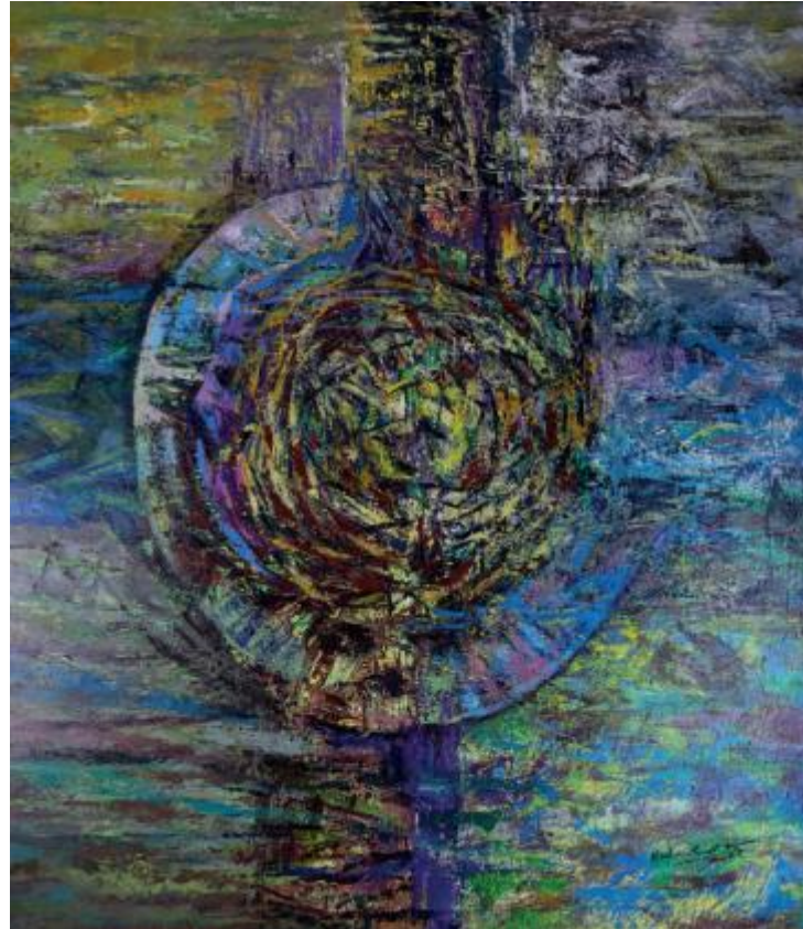
Pusran Catus Pata, 2025, Akrilik di atas kanvas, 185 x 170 cm

fisik, tetapi sebagai pusat keseimbangan, di mana manusia, alam, dan nilai spiritual saling bertemu dan saling mempengaruhi. Melalui pusran visual tersebut, karya ini menegaskan peran Catus Pata sebagai jantung kosmologi Bali yang menjaga harmoni kehidupan desa.