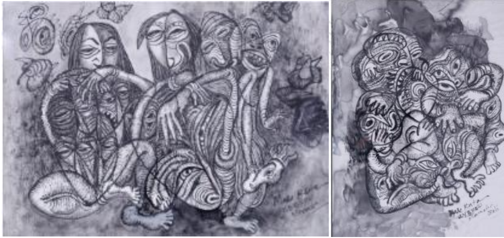
Karya Rumaket 1 dan 2, 2021, @ 42 x 30 cm,

Karya Sumber Kehidupan memaknai asal mula hidup sebagai kekuatan yang menghidupi manusia, alam, dan seluruh ruang kehidupan. Sumber ini tidak hanya dipahami secara fisik, seperti air dan tanah, tetapi juga sebagai nilai, kesadaran, dan energi yang menjaga keseimbangan hidup. Melalui karya ini, penulis mengajak untuk kembali menyadari bahwa kehidupan bergantung pada sumber yang harus dijaga bersama, karena dari sanalah keberlanjutan, harapan, dan masa depan dapat terus tumbuh.