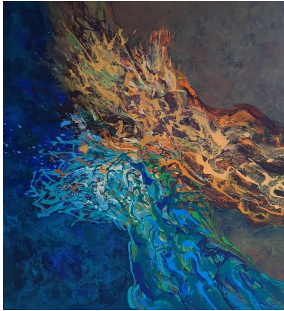
Campuhan, Akrilik di kanvas, 135 x 125 cm.

Art Jakarta 2024. Karya Lukisan Alam, Aku Ada Untukmu menempatkan alam sebagai sosok yang hadir setia bagi kehidupan manusia. Alam digambarkan bukan sebagai objek yang dieksploitasi, tetapi sebagai sahabat yang memberi ruang, perlindungan, dan kehidupan tanpa pamrih. Melalui karya ini, penulis menyampaikan pesan bahwa alam selalu hadir dan memberi, bahkan ketika manusia sering lalai dan melupakan tanggung jawabnya. Lukisan ini menjadi ajakan untuk kembali menyadari hubungan yang saling membutuhkan, di mana manusia dituntut untuk merawat dan menghargai alam sebagaimana alam telah menjaga kehidupan manusia.