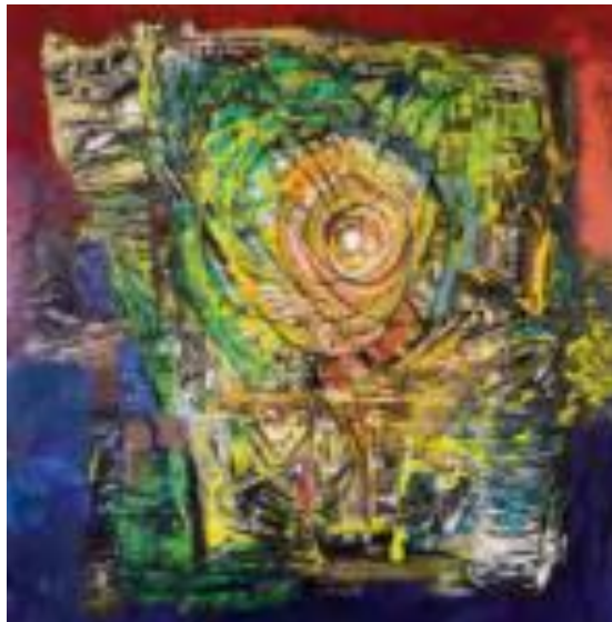
Abstraksi Tri Tunggal, 2025, akrilik di atas kanvas, 75 x 60 cm

Karya Abstraksi Tri Tunggal mengangkat makna kesatuan dari tiga unsur utama yang membentuk keseimbangan hidup. Tiga elemen ini tidak dipahami sebagai bagian yang terpisah, tetapi sebagai satu kesatuan yang saling menguatkan dan saling mengisi. Melalui bentuk-bentuk abstrak, karya ini menekankan hubungan antara manusia, alam, dan dimensi spiritual sebagai satu napas kehidupan. Tri Tunggal hadir sebagai refleksi bahwa keharmonisan tercipta ketika ketiganya berjalan seimbang dalam satu kesadaran utuh.