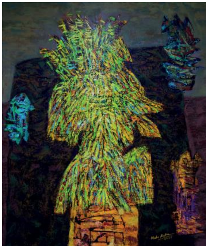
Abstraksi Bagia Pula Kerti, 2025, akrilik di atas kanvas, 185 x 170 cm

Karya Abstraksi Bagia Pula Kerti memaknai sesaji persembahan sebagai simbol kosmos yang menyatukan manusia, alam, dan spiritualitas. Bentuk-bentuk abstrak dalam karya ini merangkum makna persembahan bukan sekadar ritual, tetapi ungkapan rasa syukur, penghormatan, dan keseimbangan hidup. Setiap elemen visual merepresentasikan tatanan semesta yang saling terhubung, di mana tindakan memberi menjadi jalan menjaga harmoni kosmik. Melalui karya ini, sesaji dipahami sebagai bahasa simbolik yang menyampaikan hubungan batin manusia dengan kekuatan kehidupan yang lebih luas.