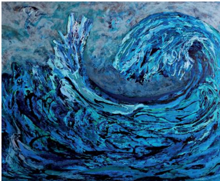
Sumber Kehidupan, 2023, akrilik di atas kanvas, 170 x 200 cm

Karya Sumber Kehidupan memaknai asal mula hidup sebagai kekuatan yang menghidupi manusia, alam, dan seluruh ruang kehidupan. Sumber ini tidak hanya dipahami secara fisik, seperti air dan tanah, tetapi juga sebagai nilai, kesadaran, dan energi yang menjaga keseimbangan hidup. Melalui karya ini, penulis mengajak untuk kembali menyadari bahwa kehidupan bergantung pada sumber yang harus dijaga bersama, karena dari sanalah keberlanjutan, harapan, dan masa depan dapat terus tumbuh.