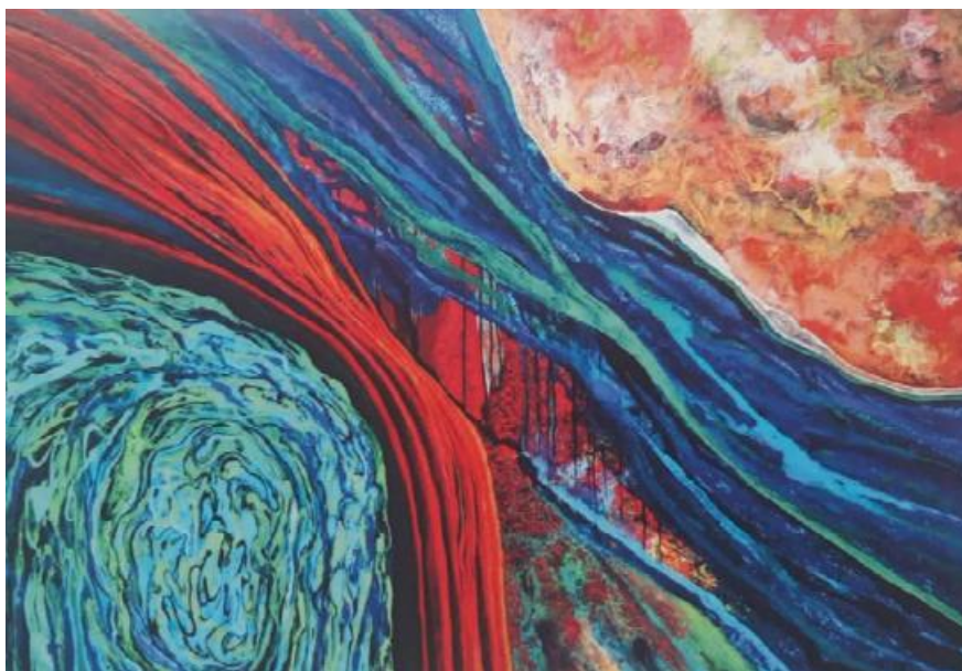
Bencana dan Anugerah, 2019, akrilik di atas kanvas, 196 x 135 cm.

Karya Bencana dan Anugerah menegaskan bahwa kehancuran dan kehidupan bukanlah dua hal yang saling meniadakan, melainkan saling terhubung dalam satu siklus yang sama. Bencana dipahami bukan semata sebagai peristiwa tragis yang merusak alam dan kehidupan manusia, tetapi sebagai isyarat keras atas ketidakseimbangan yang diciptakan oleh manusia sendiri. Di balik luka dan kehilangan, tersimpan anugerah berupa kesadaran baru, daya pulih, serta peluang untuk menata ulang hubungan manusia dengan alam secara lebih bijak. Karya ini menghadirkan refleksi bahwa dari peristiwa yang paling gelap sekalipun, selalu terbuka ruang pembelajaran, pengharapan, dan tanggung jawab moral untuk menjaga keberlanjutan hidup bersama.