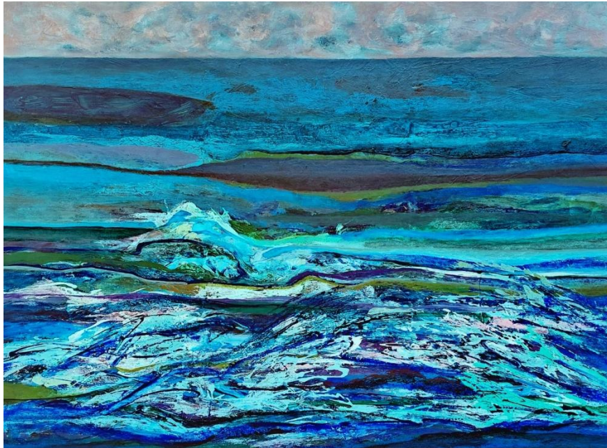
Blue Overlay, 2024, Acrylic on Canvas, 135 × 185 cm

kedalaman misteri, serta rupa sebagai wujud visual ekspresi seni. Melalui pendekatan rasa dan estetika, Blue Overlay dihadirkan sebagai upaya menenangkan batin dan menyeimbangkan dinamika hidup, sekaligus merespon hubungan manusia dengan kekuatan alam yang agung dan terus hidup.