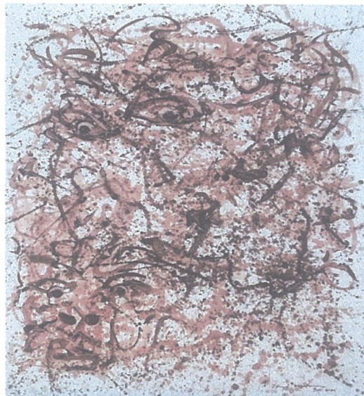
Size : 150 cm x 200 cm, Tittle of works : Kali's Eye , Medium : Coffee Skin Juice, Year : 2025

Karakter Lukisan Perasan Warna Kulit Kopi di atas Kain Kanvas.