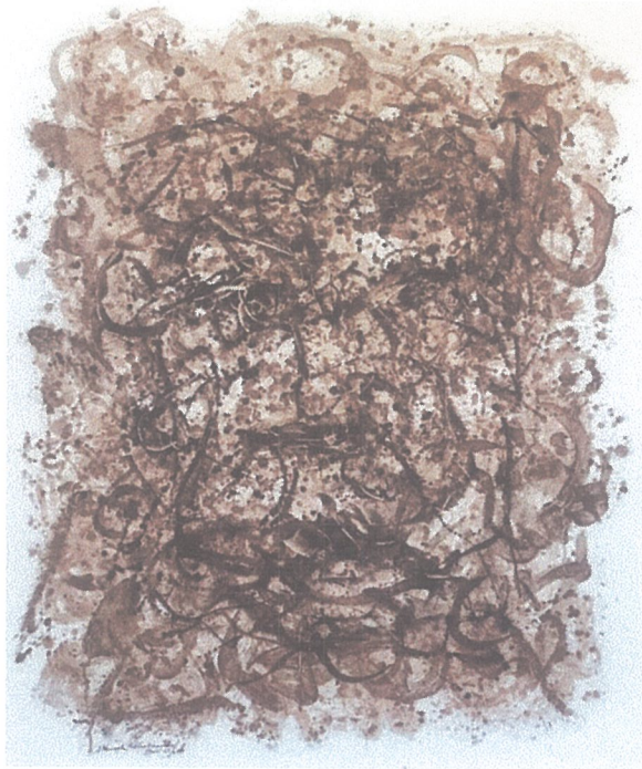
Judul : Face line 1, Ukuran :100 cm x 120 cm Medium : Coffee Fruit Sap Color, Tahun : 2025, Sumber : E-Katalog International Art Exhibition,Environment & Humanity, 6-9 Desember 2025.

Penelusuran penulis membaca, Judul Lukisan : Facial line 1, Medium : Coffee Fruit Sap on Canvas, Ukuran : 100 cm x 120 cm, Tahun: 2025, Ekspresi jiwa berontak di atas kanvas, luapan nada dan warna perasan kulit kopi panas melumuri raga, kanvas yang lusuh putih berdebu. Natural rasa, kulit kopi diremas kuat-kuat tumpahkan meresap bagai belerang panas. Kanvas yang lusuh menghisap tekture warna coklat tua, jemari tangan gemetar menerjang pisau palette, kuas yang kaku keras menggores garis-garis silang, siqsaq, garis patah-patah, garis terputus dan garis spontanitas bergelombang melesat anak panah nada. Warna natural perasan kulit kopi digoreskan di atas bidang kanvas ukuran 100 cm x 120 cm, tampak sangat menarik perhatian kita untuk mengamatinya sebagai terafi jiwa dan meditasi rasa yang menakjubkan.