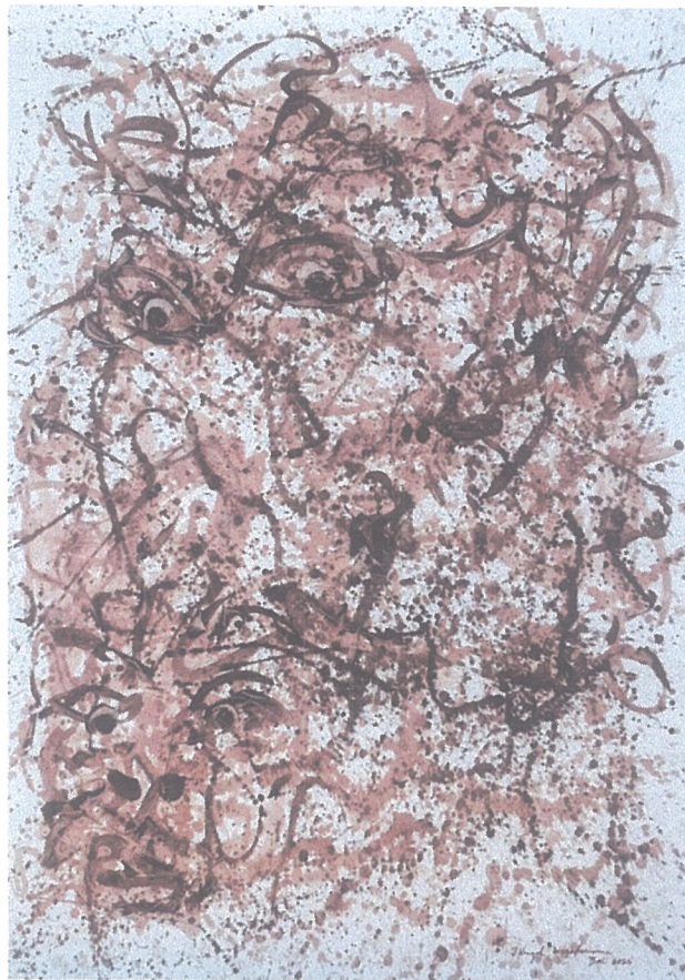
Judul : Kali'Eye, Ukuran :150 cm x 200 cm Medium : Coffee Skin Juice, Tahun : 2025,

makna terhadap karya yang sedang diamati, adalah keingintahuan akan ‘asal mula karya itu tercipta’, ‘ide kreatif apa yang muncul dan dipilih untuk dikembangkan’, apa ‘konsep dan intensi individual sang kreatif ketika ia mengerjakan karyanya’. Namun kenyataannya, tidak banyak creator seni yang meluangkan waktu dan pemikirannya untuk melengkapi karyanya dengan data, informasi, narasi kreatif tentang karyanya, sesungguhnya secara disadari maupun tidak mengusung nilai yang sedang ia hayati oleh publik, pengamat seni dan pecinta seni.