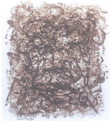
Size : 100 cm x 120 cm, Tittle of works : Face line 1 , Medium : Coffee Fruit Sap on Canvas. Year : 2025

Karakter Lukisan Perasan Warna Getah Kulit Kopi di atas Kanvas.