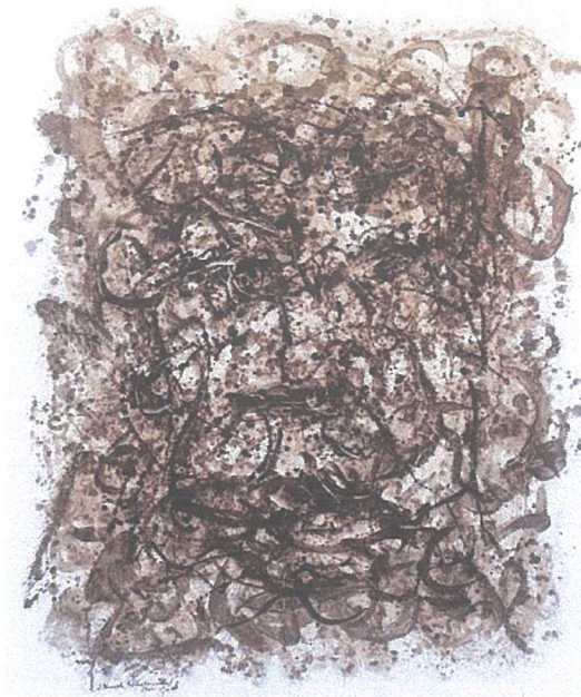
Title : Facial line 1

Size : 100 cm x120 cm, Medium : Coffee Fruit Sap on Canvas, Year: 2025