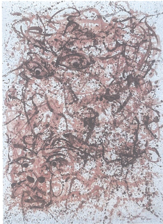
Title of works : Kali's Eye , Size : 150 cm x 200 cm, Medium: Coffee Skin Juice, Year : 2025

Seni Lukis Ekspresionis Kontemporer, I Nengah Wirakesuma.