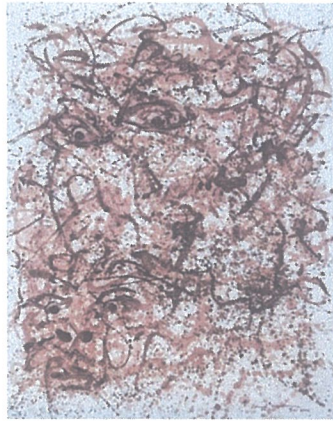
Artist : I Nengah Wirakesuma, Tittle of works : Kali's Eye , Size : 145 cm x 200 cm Medium : Coffee Fruit Sap Color. Year : 2025, di Koleksi : Mr. Deve Evans, Australia.

Kali's Eye , Sejak peristiwa Covid-19 melanda dunia, Saya meluangkan waktu untuk berkebun kopi. Memangkas semua pohon kopi lokal setinggi 120 cm. Setelah tumbuh tunas air pada pohon induknya dilanjutkan dengan penyambungan dengan entres kopi robusta. Eksperimen penyambungan tunas-tunas air pada kopi lokal dengan kopi robusta menghasilkan pertumbuhan tunas dan daun yang subur, berkembang, berbunga dan berbuah lebat. Perwujudan Wajah primitif sebuah obsesi yang sering muncul dalam pikiran saya. Warna kulit kopi menarik perhatian saya, warna kulit kopi digoreskan berulang kali dengan sapuan kuas yang bervariasi. Penciptaan Kali's Eye menggunakan goresan spontanitas dengan pisau palet, kemudian dikombinasikan dengan penyerapan warna kulit kopi dengan kain basah untuk mencapai perpaduan warna, garis, ruang, dan tekstur yang harmonis. Penulis dapat menganalisis dan mencermati progress penciptaan karya seni lukis berjudul, Kali's Eye , terungkap secara spontanitas dengan sapuan kuas kecil, kuas besar dan pisau palet yang ekspresif dan liar dikombinasikan dengan menyerap warna kulit kopi menggunakan kain kering dan basah, guna mencapai keseimbangan harmonis antara garis, warna, ruang, dan tekstur. Kali's Eye , dirancang sejak pandemi Covid-19 melanda dunia, Senimannya meluangkan waktu memetik buah kopi yang merah untuk direbusnya dan air rebusannya digunakan sebagai medium dalam penciptaan karya seni lukis di atas kain kanvas