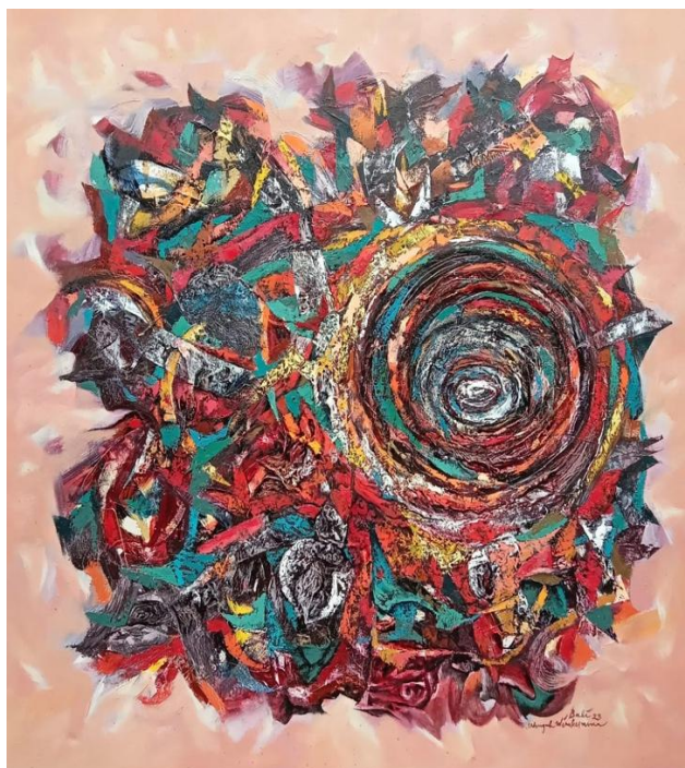
Gambar : 2, Judul : “Poros Bumi” Teknik : Oil on Canvas, Ukuran : 135 cm x 135 cm, Tahun Pembuatan : 2022, Koleksi : Dr.dr. Dewasahadewa.

Poros Bumi adalah sebuah konsep geografis yang merujuk pada garis khayal yang membentang dari Kutub Utara ke Kutub Selatan, melalui pusat Bumi. Konsep ini juga memiliki makna filosofis dan spiritual, yang terkait dengan keseimbangan dan harmoni alam. Poros Bumi, sebagai garis lintang yang membagi Bumi menjadi dua belahan, yaitu Belahan Utara dan Belahan Selatan. Poros Bumi juga terkait dengan rotasi Bumi, yang menyebabkan perubahan musim dan siang-malam.