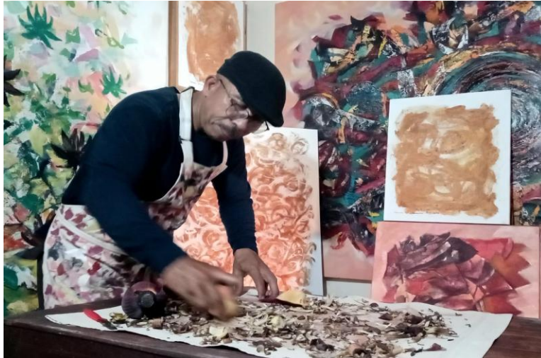
Gambar : 5, Eksperimen Medium Getah Jantung Pisang Studio WkArt25, Jl.Drupadi XVII, Gang Dewi Uma No : 12 Sumerta Kelod Denpasar

Muatan perasaan dalam karya seni harus dibersihkan, disucikan, dan dikendalikan melalui disiplin seni. Melalui pengolahan inilah emosi memperoleh makna. Ketidakmampuan mengendalikan perasaan mencerminkan kekacauan, yang pada akhirnya kehilangan makna. Dalam konteks seni, musuh utama bukanlah emosi, melainkan ketiadaan keteraturan bentuk, ketiadaan pola, dan ketiadaan struktur. Seni menuntut adanya kesatuan dan keutuhan yang tersusun dalam pola yang teratur. Kekacauan menjadi musuh seni karena di dalamnya tidak terdapat struktur yang mampu menyatukan unsur-unsur menjadi suatu makna yang utuh. Dengan demikian, seni bukan sekadar luapan perasaan, melainkan hasil pengendalian emosi melalui struktur yang teratur sehingga melahirkan karya yang bermakna, memiliki nilai-nilai estetika yang tinggi.