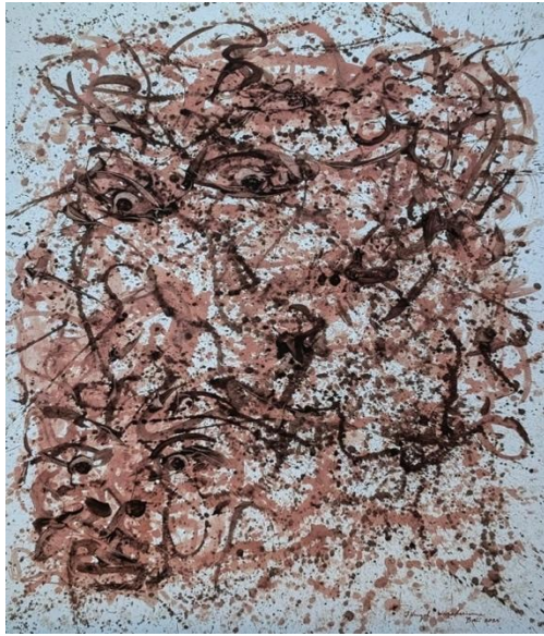
Gambar : 10, Tittle of works : Kali's Eye . Size : 150 cm x 200 cm, Medium : Coffee Skin Juice. Year : 2025