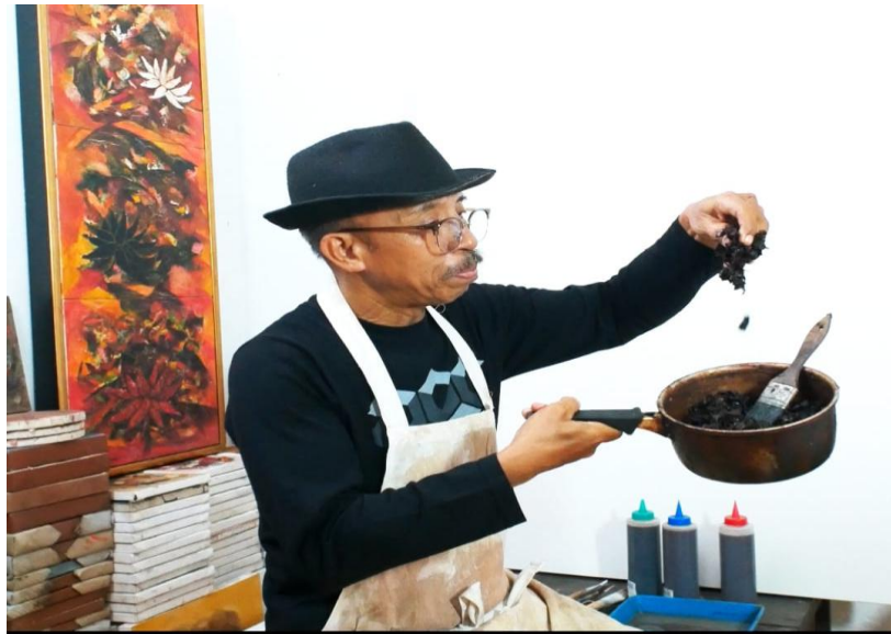
Gambar : 8, Eksperimen Medium Getah Kulit Kopi Studio WkArt25, Jl.Drupadi XVII, Gang Dewi Uma No : 12 Sumerta Kelod Denpasar

Seiring berjalanya sang waktu pohon kopi sudah mulai tumbuh subur dan berbunga lebat. Bau harum bunga kopi menyeruak ke areal kebun kopi. Ia mengambil bunga kopi itu kemudian menciumnya dengan penuh dahaga. Bunga kopi yang serentak berwarna putih menyebar pada setiap tangkai dan batang yang berbentuk (Parabola). Sejak itu tampak luluh terhanyut selalu berada di kebun kopi, mengamati bentuk pohon dan struktur tumbuh tunas, daun-daun, bunga putih dan menjadi buah kopi berwarna merah yang mengarah ke segala penjuru mata angina.