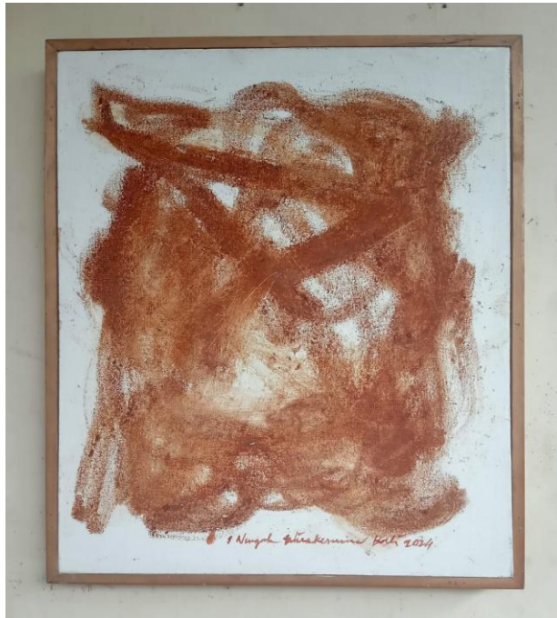
Gambar : 7, Judul: Estetika Warna dan Garis 3, Bahan: Kulit Manggis, Ukuran: 40 cm x 60 cm, Tahun: 2024.

Analisis warna kulit manggis seni lukis yang berjudul; Estetika Warna 3, merupakan perwujudan karya cipta seni lukis di atas kain kanvas yang berukuran 60 cm x 90 cm, bahan yang digunakan adalah warna kulit manggis, diciptakan pada tahun 2024. Sebelum melukis di atas kain kanvas dilapisi dengan cat berwarna putih dengan merk Meri'es Acrylic Colour, A-4500, 104, Titanium White dengan tujuan agar serat-serat dan pori-pori kain kanvas tertutup dengan rapat dan permukaan kain kanvas menjadi lebih halus. Proses penciptaan seni lukis dengan medium Warna kulit manggis dilakukan dengan teknik membelah kulit manggis menjadi dua bagian kemudian kulit manggis di peras dan diremas dengan jari-jari tangan agar mengeluarkan warna merah-keunguan dan biru, kemudian pada tahap pemolesan perasan kulit manggis di atas kain kanvas dilakukan penekanan jari-jari tangan secara lembut, sedang dan keras agar warna kulit manggis memiliki karakter warna coklat muda dengan tekture semu yang bervariasi serta memiliki efek artistik, klasik, unik dan menarik perhatian orang lain yang mengamatinya.