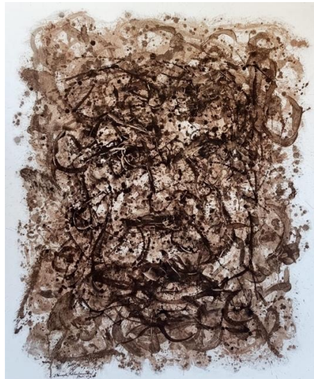
Gambar : 9, Tittle of works : Facial lines I . Size : 100 cm x 120 cm, Medium : Coffe Fruit Sap on Canvas. Year : 2025