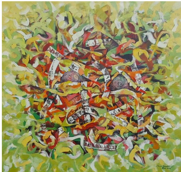
Gambar : 4, Judul Karya : Sumber Mata Air, 2, Ukuran : 180 cm x 180 cm Bahan : Oil on Canvas. Tahun : 2023,