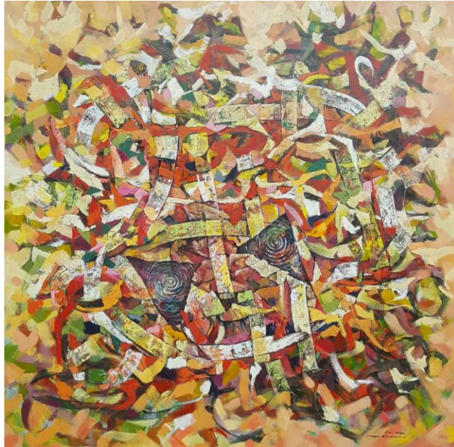
Gambar: 3, Judul Karya : Sumber Mata Air 1 Ukuran: 180 cm x 180 cm, Media : Oil on Canvas Tahun: 2023