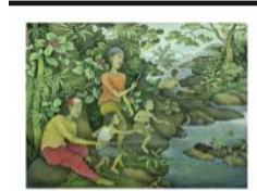
Dok. 4. Isi Katalog Pameran Bali Kanda Rupa 2024 Charma Manu Candika (Sastra Rupa Karaman Artistika)