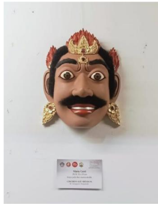
Dok. 1. Foto Karya Manu Geni pada Pameran Bali Kanda Rupa ”Charma Manu Candika” di Gedung Kria Art Centre 2024