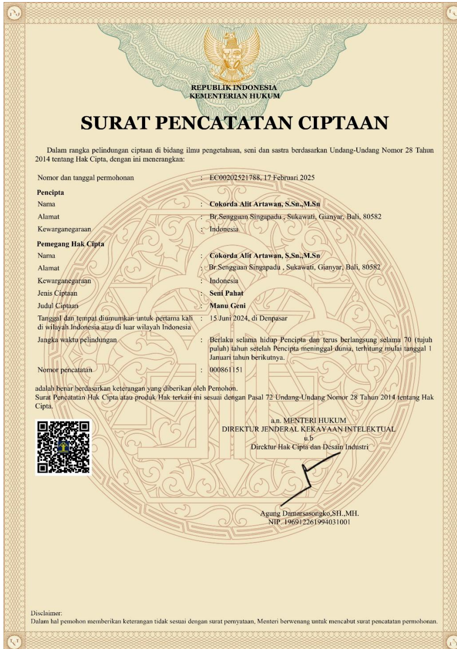
Dok. 4 HKI karya Manugeni

Link Katalog Pameran Pameran Bali Kanda Rupa 2024 Charma Manu Candika (Sastra Rupa Karaman Artistika)