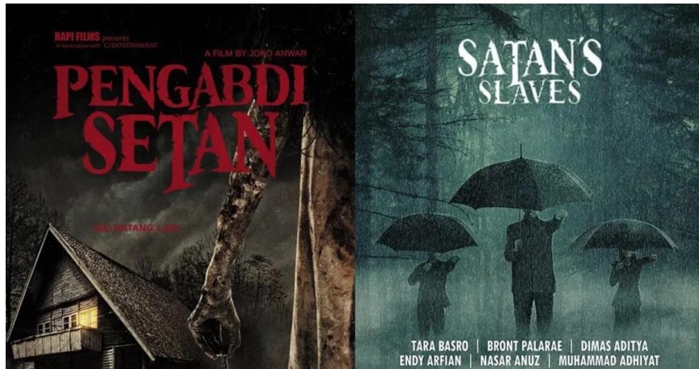
Gambar 1. Poster Pengabdi Setan (2017) Dalam VS Luar Negeri

Pemilihan poster Pengabdi Setan versi dalam dan luar negeri menjadi objek penelitian yang akan kita gali lebih dalam. Berdasarkan pengamatan awal poster film Pengabdi Setan versi dalam negeri menampilkan visual yang eksplisit. Hal ini terlihat dari visual pemandangan yang suram, sebuah rumah tua sebagai fokus tampak depan, pada separuh area poster tampil sosok manusia dengan pakaian Wanita, berambut Panjang hitam penuh luka, penggambaran karakter secara misterius dengan cara pemanfaatan porsi area poster secara masif. Dengan ini, poster versi indonesia cenderung mengarahkan audiens untuk segera mengenali genre, suasana yang ada pada film. Sedangkan pada poster versi luar negeri, menggunakan visual yang minimalis dan misterius. Melalui penelitian ini, kita dapat menganalisa Kedua poster tersebut melalui prinsip gestalt. Bagaimana proximity, closure, similarity, continuity, serta figure and ground menjelaskan komposisi visual dapat mempengaruhi dan menarik perhatian audiens yang melihat poster tersebut.